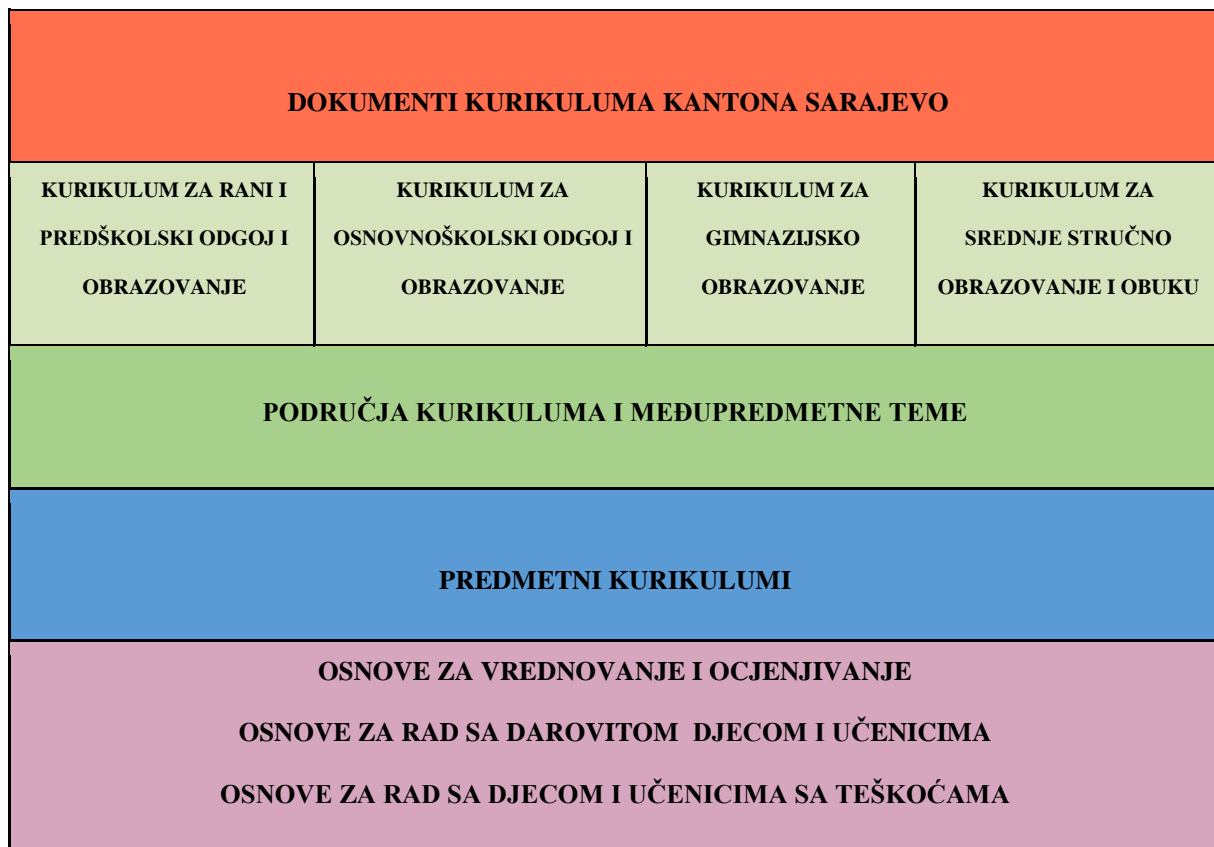
Slika 1. Sistem dokumenata Kurikuluma Kantona Sarajevo